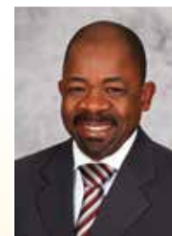
Mna IT Tselane Motlatšamodulasetulo