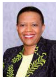
Moatbokheite FDP Tlakula Modulasetulo

Khomišene ya Dikgetho e na le bokhomišenare ba bahlano, gomme yo mongwe wa bona o swanetše go ba moahlodi. Bokhomišenare ba ba thwalwa go šoma mengwaga e šupa ke Mopresidente wa Afrika Borwa. Nako ya bona ya go šoma e ka mpshafatšwa gatee fela.