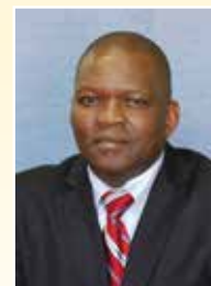
Moruti BB Finca Mokhomišenare